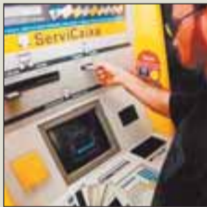
La Caixa es pionera en el mercado español.

Estas máquinas ya no son lo que eran. Los cajeros automáticos aumentan sus prestaciones extrabancarias: ya sirven incluso para pedir hora al médico | P.7